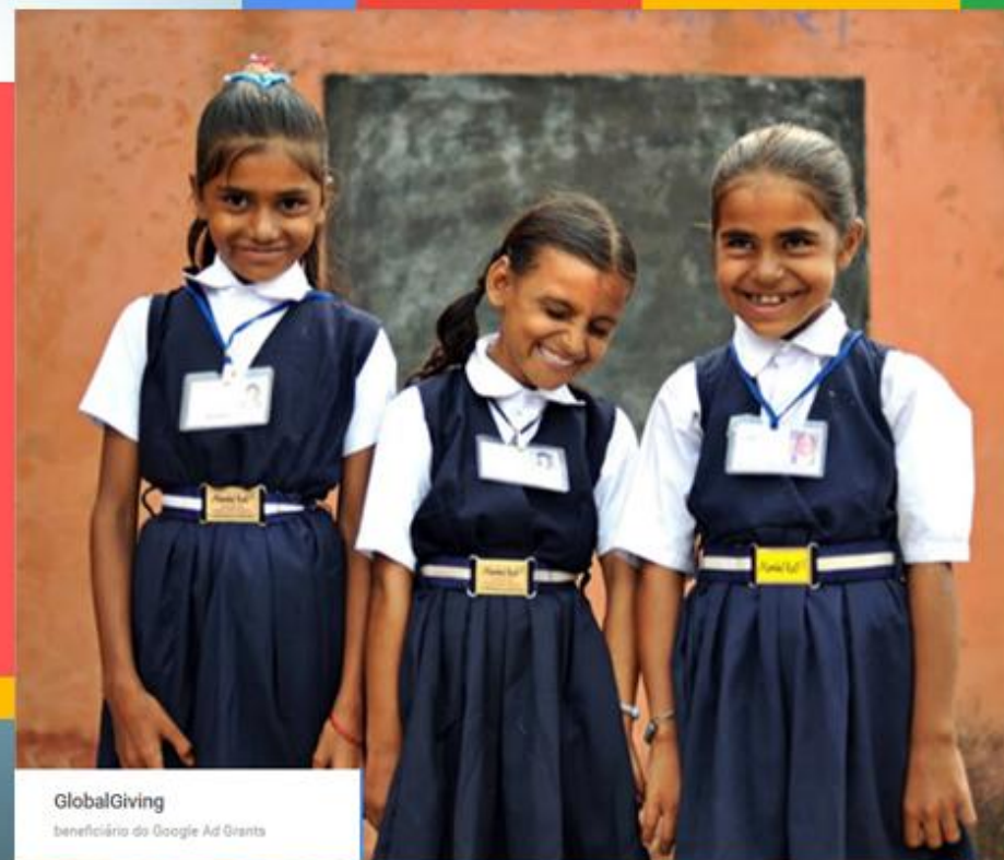
GlobalGiving beneficiário do Google Ad Grants